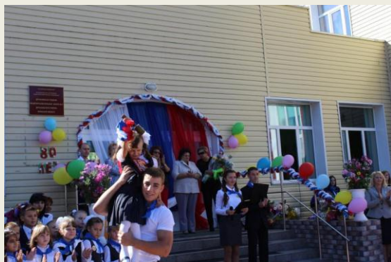
Первый звонок - на первый урок