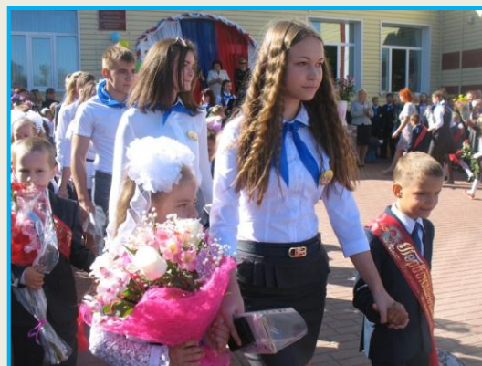
Первый раз – в первый класс