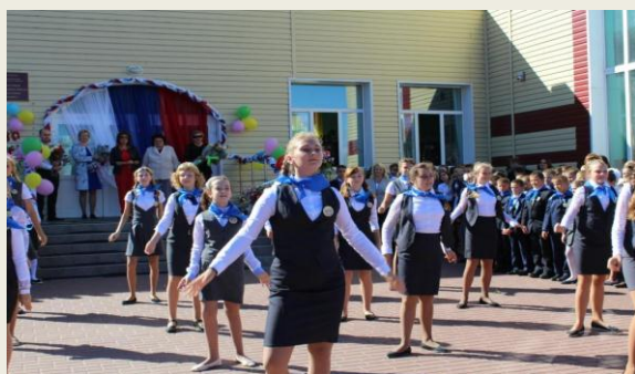
Поздравления первоклассникам от учащихся школы