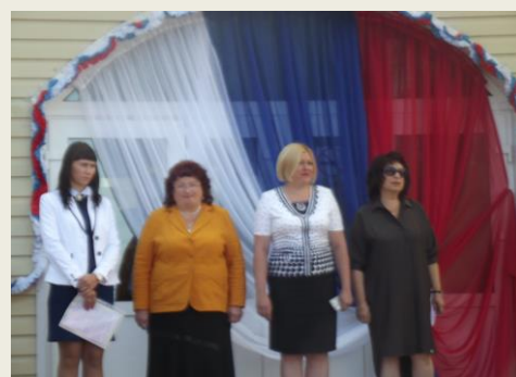
Администрация и гости школы во время торжественной линейки