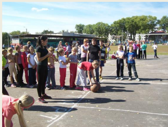
1 место «Веселые старты» 2-5 класс