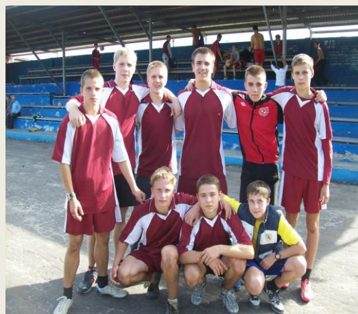
Сборная команда ДСОШ № 5