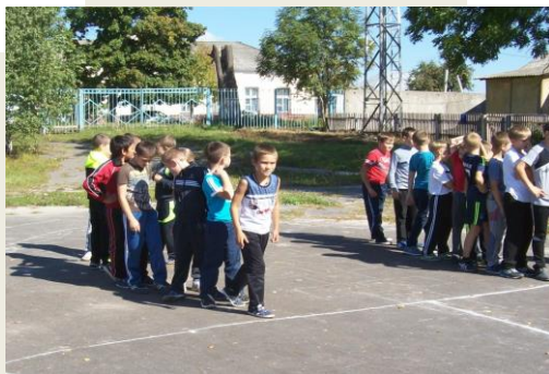
Встречная эстафета 3 место