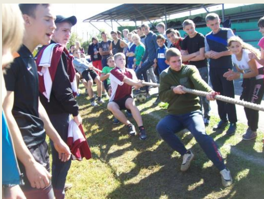
1 место в перетягивании каната

Сентябрь для спортсменов нашей школы один из насыщенных месяцев. Учащиеся со второго по одиннадцатый класс приняли участие в «мини – футболе», в районном и областном фестивале «Дети Чернобыля», прекрасно показали себя в осеннем легкоатлетическом кроссе и «кроссе Нации». Достоинно наша школа выступила и в ГТО.