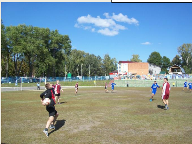
«В напряженной игре по мини – футболу»