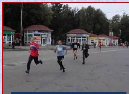
Традиционная эстафета 3 место