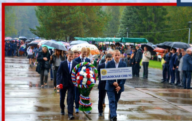
День освобождения Брянщины от немецко- фашистских захватчи- ков