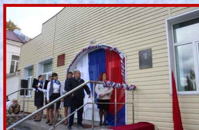
Открытие мемориальной доски