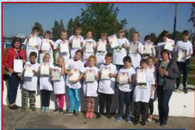
Областные соревнования «Дети Чернобыля» 1 место

Традиционно в сентябре в нашем районе проходит огромное количество различных соревнований. Мини-футбол, лёгкоатлетическая эстафета, «Дети Чернобыля», осенний легкоатлетический кросс, фестиваль ГТО. Учащиеся нашей школы приняли участие во всех соревнованиях и показали неплохие результаты.