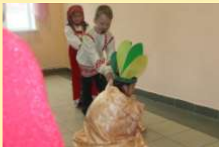
1б класс «Репка»