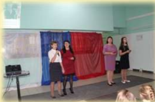
Песня: «Ты моя»