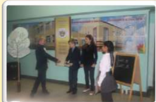
1 место 6а класс: «В стране невыученных уроков»