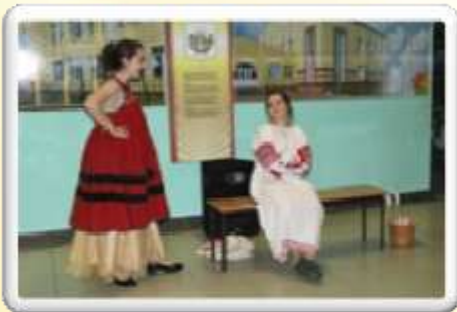
1 место: 8а класс «Барышня – крестьянка»

С 26 по 30 октября 2018 года прошёл школьный театральный фестиваль «Театр, где играют дети». Фестиваль проводился с целью социализации учащихся путём привлечения к фестивальной деятельности, развития у учащихся творческого потенциала, воспитания художественно-эстетического вкуса с помощью театрального искусства, а также приобщения детей к отечественному и мировому культурному наследию. В течении трех дней учащиеся школы следили за выступлениями своих одноклассников. Как и в любом конкурсе есть свои победители и побежденные, но все запомнили театральные композиции и уже строят планы к следующему фестивалю.