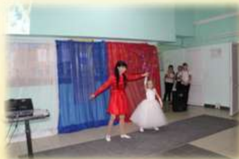
Танец: «Мой ангел»

В этот день хочется сказать спасибо всем мамам на планете за самый лучший подарок — жизнь! Дорогие наши мамы поздравляем вас с днем матери и желаем душевных сил, жизненной мудрости, ангельского терпения, женского счастья, взаимной любви и домашнего уюта. Спасибо вам родные за то тепло, нежность, ласку и заботу, которые вы так искренне нам отдаете. Желаем вам, наши дорогие, всегда и везде чувствовать себя нужными и любимыми.