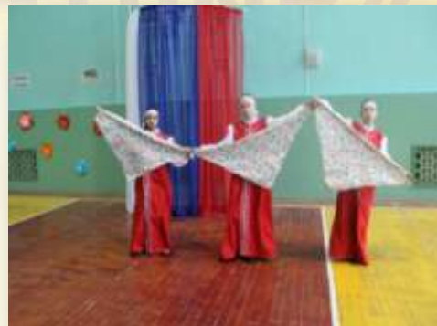
7б класс «Хоровод»

Ноябрь выдался очень напряженным месяцем в плане творческой подготовки к конкурсу «Я талантлив». Этот конкурс в школе уже стал традиционным и помогает реализовать творческий потенциал учащихся в условиях самореализации. В конкурсе могли принять участие учащиеся с 1 по 11 класс МАОУ ДСОШ № 5 и их родители. В следующих номинациях : «Вокал», «Хореография», «Эстрадные миниатюры». С 19 по 22 ноября школа превратилась в творческую студию, где дети постоянно распевались, повторяли «Па» или что-то импровизировали. У жюри была сложная задача отобрать самых лучших из представленных номеров.