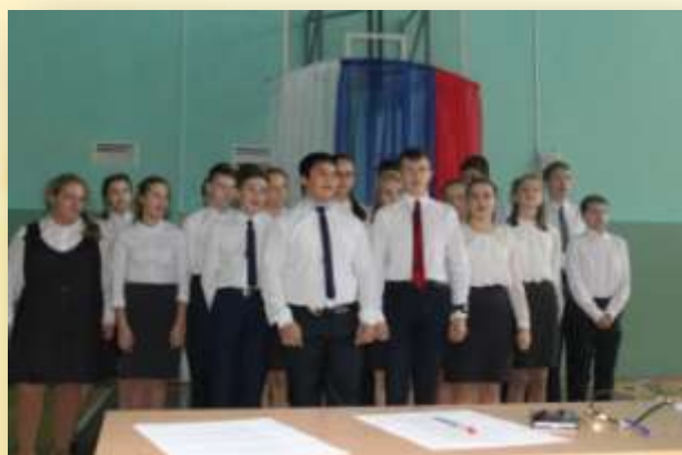
Хор 8а класса «Алые паруса»