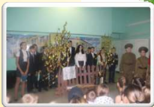
«Театр, где играют дети»