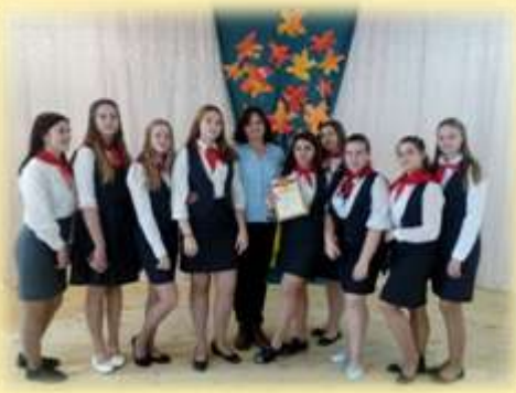
Районный конкурс: «Взвейтесь кострами!»