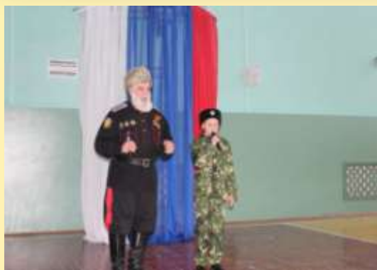
За класс: «Казачья песня»