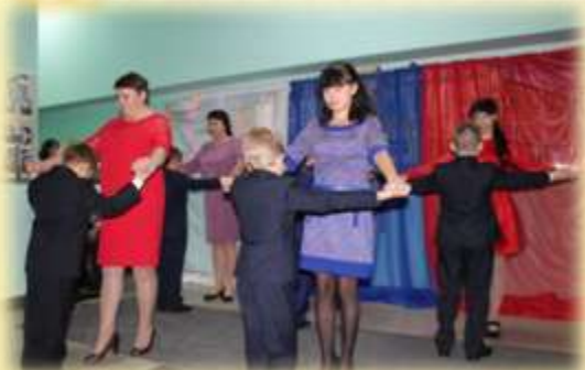
Танец: «Я люблю тебя сынок»