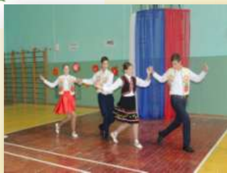
«Общешкольный конкурс «Я талантлив»