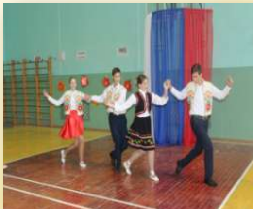
10 класс «Молдавский танец»