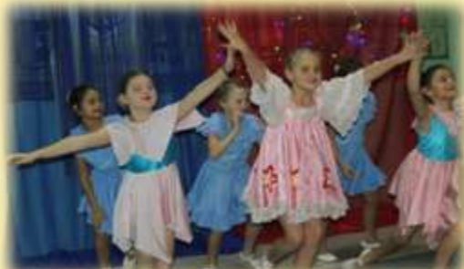
Танец 3 б класс: «Веснушки»