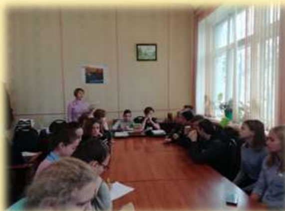
Увлекательное путешествие по родному краю