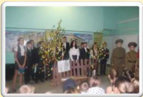
2 место: 7а класс «Сын полка»