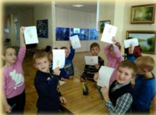
«С пользой и весело»