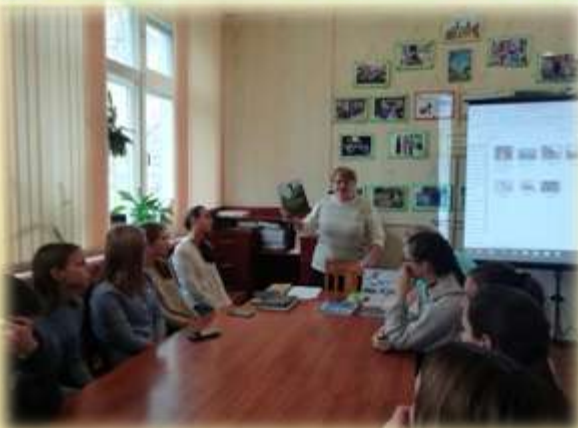
В Дятьковской городской библиотеке