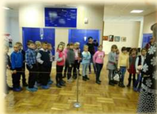
Экскурсия по музею