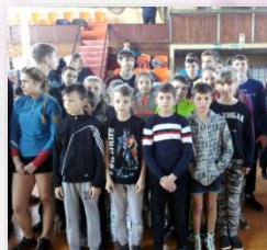
Районный фестиваль ТПО