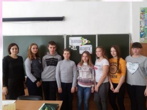
7 класс «Экологическое ассорти»