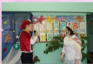
Концерт ко Дню 8 Марта