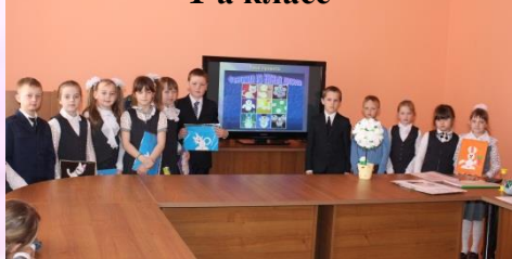
«Фантазии из ватных дисков» 1-а класс