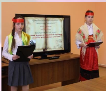
«Герои русских былин. Илья Муромец» 6-б класс