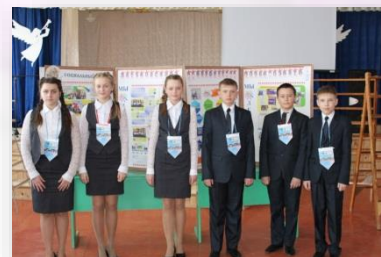
Итог социального проектирования