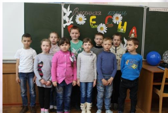
1-а, 1-б классы конкурсно-развлекательная программа «Весенняя капель»