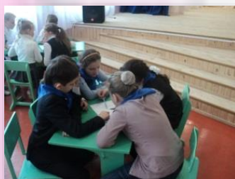
Марафон «Твои возможности»