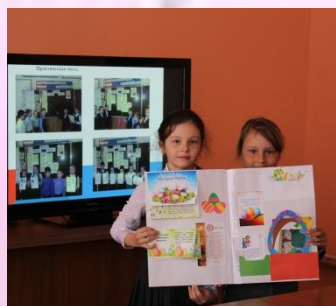
Лэпбук «Пасха» 2-б класс