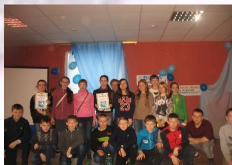
6-а, 6-б классы познавательно-игровая программа «День воды»