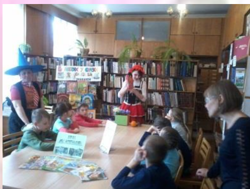
2-б, 4-а классы, квест – игра "Вас ждут приключения на острове чтения"