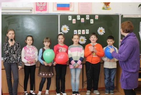
3-б класс караоке-клуб «Наши любимые песни из мультфильмов»