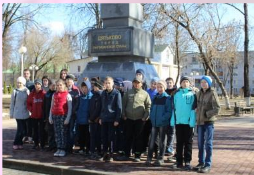
5-а, 5-б классы, экскурсия «Точки Памяти «Знаки Победы»

Весенние каникулы – это прекрасная пора для детей и взрослых. Классные руководители старались продумать всё, чтобы весенние каникулы стали для ребят максимально полезными для здоровья и развития.