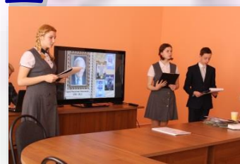
НТК «Поиск и творчество»