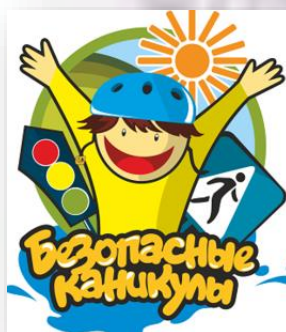
Техника безопасности на каникулах