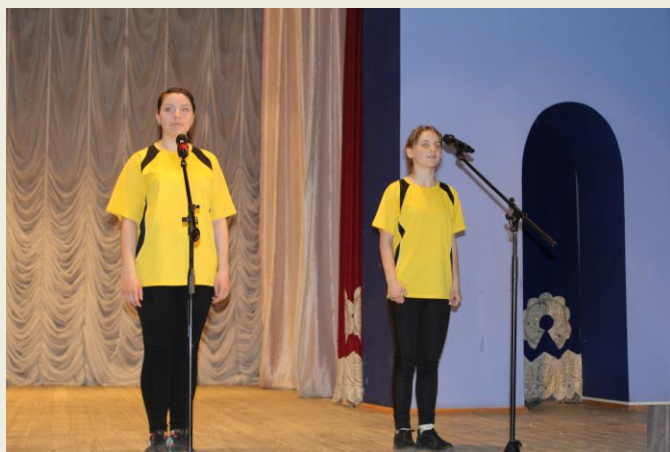
Участницы команды «Оптимисты» во время выступления