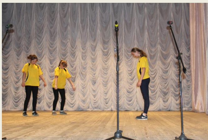
КВН агитбригадами команд.

"Дружно, вместе, с оптимизмом- за здоровый образ жизни". Следующий конкурс - "Разминка". Ребятам нужно было придумать сценку в виде социальной рекламы, пропагандирующей здоровый образ жизни. Во время этого конкурса группа художников от каждой команды рисовала листовку на заданную тему. Завершился