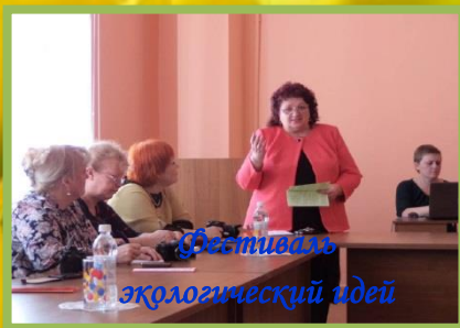
Фестиваль экологический идей