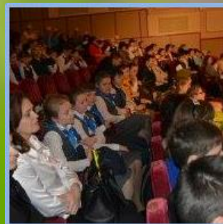
«Я гражданин России»