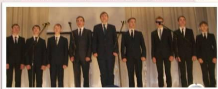
Конкурс патриотической песни «Пою моё Отечество»