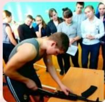
Дело мастера бьется