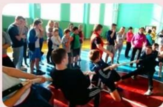
Тянем - потянем