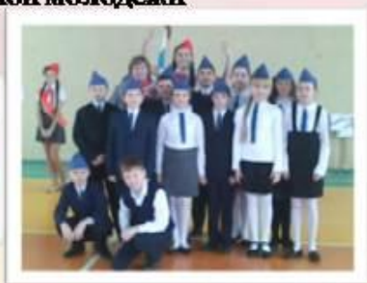
Тропа к генералу