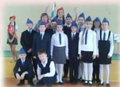
Месячник оборонно-массовой работы