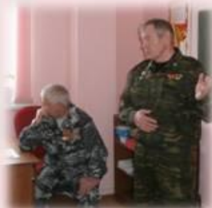
Ты же выжил солдат