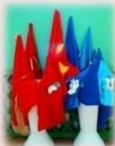
На старте большая игра