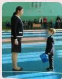
Самый маленький командир