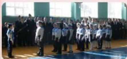
За мной шагом марш