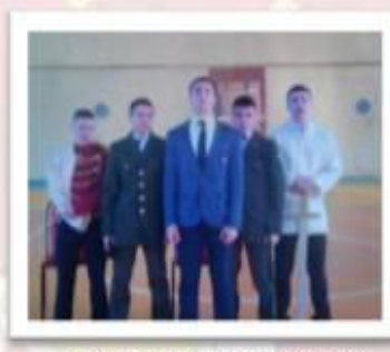
«А ну-ка, парни!»

«Школьный улей» №6 (108), февраль 2016года