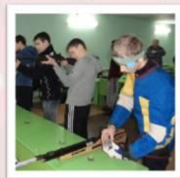
Зимняя спартакиада допризывной молодёжи