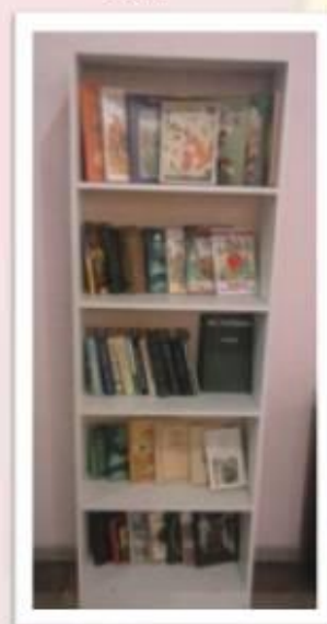
Устанавливаются книжные полки

Работа над социальным проектом находится на завершающем этапе. Прошли переговоры с административными структурами разного уровня, в различных организациях. Изучена литература по законодательным и правовым аспектам создания доступной литературы в местах массового пребывания людей. Проведена переписка с организациями непосредственно связанными с установкой полок под художественную литературу. В МКДЦ уже установлена книжная полка, которая позволяет сделать вывод о актуальности выбранной нами проблемы.