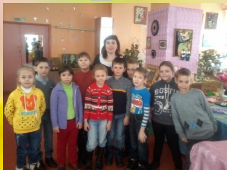
2-а класс, посещение выставки «Волшебство детских рук»