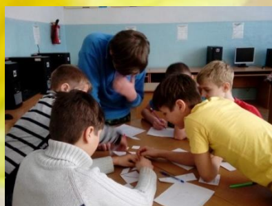
7-б класс, интеллектуальная викторина «Весенний калейдоскоп»