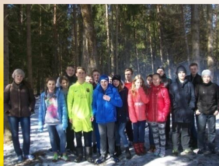
8-а, 7-а классы, экскурсия в лес «Партизанскими тропами»