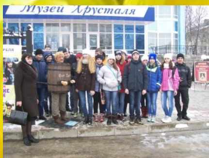
8-б, 7-а класс, экскурсия по городу